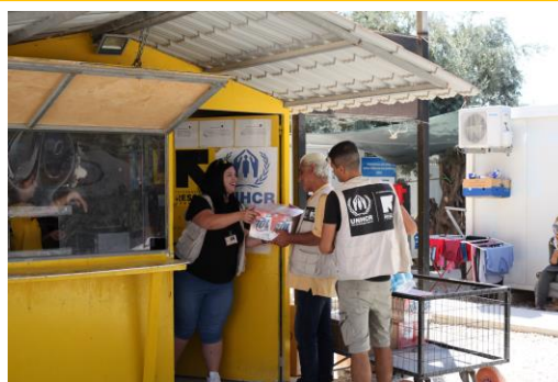
Κιόσκι διανομής ειδών πρώτης ανάγκης στο Καρά Τεπέ. Λέσβος, 2019

Η IRC παρέχει υπηρεσίες στο δημοτικό κέντρο φιλοξενίας προσφύγων Καρά Τεπέ, στη Λέσβο, από την ίδρυσή του το 2015. Το κέντρο αυτό προσφέρει στέγαση σε περίπου 1.300 από τους πιο ευάλωτους ανθρώπους, κυρίως οικογένειες, συμπεριλαμβανομένων περίπου 750 παιδιών. Εξασφαλίζουμε τη λειτουργία των γεννητριών, εγκατάσταση και συντήρηση υποδομών υδροδότησης και αποχέτευσης, παροχή ζεστού νερού, καθημερινό καθαρισμό των κοινόχρηστων εγκαταστάσεων υγιεινής και όλων των περιβάλλοντων ανοιχτών χώρων, συντήρηση κλιματιστικών και υποδομών πυροπροστασίας, βελτιωτικές τεχνικές εργασίες, υπηρεσίες προώθησης ορθών πρακτικών υγιεινής και διανομή ειδών ατομικής υγιεινής και άλλων μη βρώσιμων