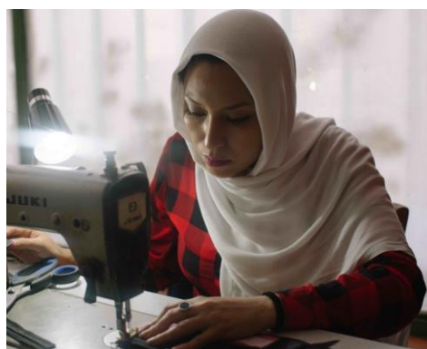
Φαρίμπα, επωφελούμενη του προγράμματος Business for YOUth Αθήνα, 2019

Η IRC Hellas μαζί με τον εταίρο της, Alba Graduate Business School, the American School of Greece, υλοποιεί το πρόγραμμα “Craft your Business” που προσφέρει επιχειρηματική κατάρτιση και καθοδήγηση σε νέους και νέες ως προετοιμασία για την αυτοαπασχόληση. Με αφετηρία διαγωνισμούς επιχειρηματικού σχεδιασμού η IRC παρέχει καθοδήγηση και διασύνδεση με έμπειρους μέντορες και