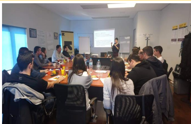
Σεμινάριο για την έμφυλη βία σε επαγγελματίες ‘πρώτης γραμμής’. Αθήνα, 2019

Τον Σεπτέμβριο του 2018, η IRC Hellas, σε συνεργασία με το Κέντρο Γυναικείων Μελετών και Ερευνών Διοτίμα, τη Γενική Γραμματεία Οικογενειακής Πολιτικής και Ισότητας των Φύλων του Υπουργείου Εργασίας και Κοινωνικών Υποθέσεων και το Κέντρο Ερευνών για Θέματα Ισότητας, ξεκίνησαν το πρόγραμμα “SURVIVOR” για την ενίσχυση της ποιότητας και της προσβασιμότητας των ελληνικών υπηρεσιών για γυναίκες πρόσφυγες και μετανάστριες επιζήσασες έμφυλης βίας και για την ενίσχυση του διακρατικού διαλόγου και της ανταλλαγής βέλτιστων πρακτικών στην Ευρώπη.