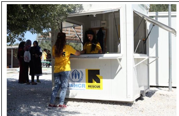
Το περίπτερο πληροφοριών της IRC στη δημοτική δομή φιλοξενίας του Καρά Τεπέ. Λέσβος

Η IRC παρέχει υπηρεσίες στο δημοτικό κέντρο φιλοξενίας προσφύγων Καρά Τεπέ, στη Λέσβο, από την ίδρυσή του το 2015. Το κέντρο αυτό προσφέρει στέγαση σε περίπου 1.200 από τους πιο ευάλωτους αιτούντες/σες άσυλο, κυρίως οικογένειες. Εξασφαλίζουμε τη λειτουργία των γεννητριών, εγκατάσταση και συντήρηση υποδομών υδροδότησης και αποχέτευσης, παροχή ζεστού νερού, καθημερινό καθαρισμό των κοινόχρηστων εγκαταστάσεων υγιεινής και όλων των περιβάλλοντων ανοιχτών χώρων, καθαρισμό και συντήρηση των χώρων στέγασης των διαμένοντων, συμπεριλαμβανομένης της συντήρησης κλιματιστικών και υποδομών πυροπροστασίας, βελτιωτικές τεχνικές εργασίες, υπηρεσίες προώθησης ορθών πρακτικών υγιεινής και διανομή ειδών ατομικής υγιεινής και άλλων μη βρώσιμων ειδών πρώτης ανάγκης, παροχή αναγκαιών πληροφοριών σχετικών με τη λειτουργία και τους φορείς που δραστηριοποιούνται στο Κέντρο, υπηρεσίες μεταφοράς στους ωφελούμενους προς απαραίτητες υπηρεσίες καθώς και υποστήριξη στη Διεύθυνση του κέντρου, μέσω της απόσπασης 25 μελών του προσωπικού για την υποστήριξη της διαχείρισης της εγκατάστασης.